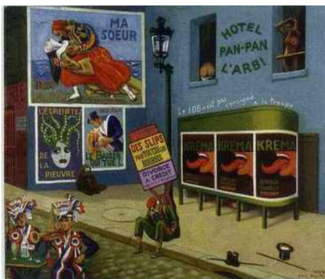
La rue des enfants trouvés, 1934-1966, huile / toile, 46 x 55

Catalogue Editions Somogy. Relié. 93 illustrations couleur. 144 p. 22€