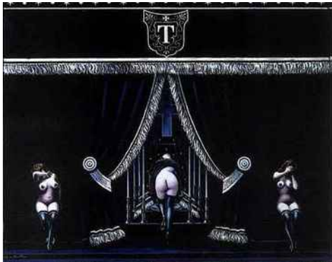
Mes funéraiilles 1 Première classe 1946, huile /toile, 65 x 81

Voyou Voyant Voyeur -Autour de Clovis Trouille (1889-1975)