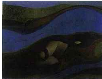
Max Ernst Le Jardin de la France

" J'accorde au peintre le droit de parler, de rire, de prendre position et de jouir de toutes ses facultés hallucinatoires. Refus absolu de vivre comme un tachiste ". Ainsi, en 1967, Max Ernst, l'un de plus importants pionniers de l'avant-garde internationale du XX e siècle, définissait le rôle du peintre au sein de la société. Le Musée des Beaux-Arts de Tours a organisé une